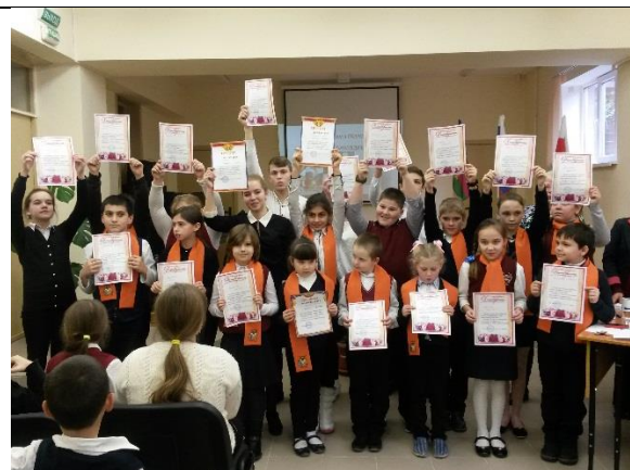
Призеры и участники конкурса